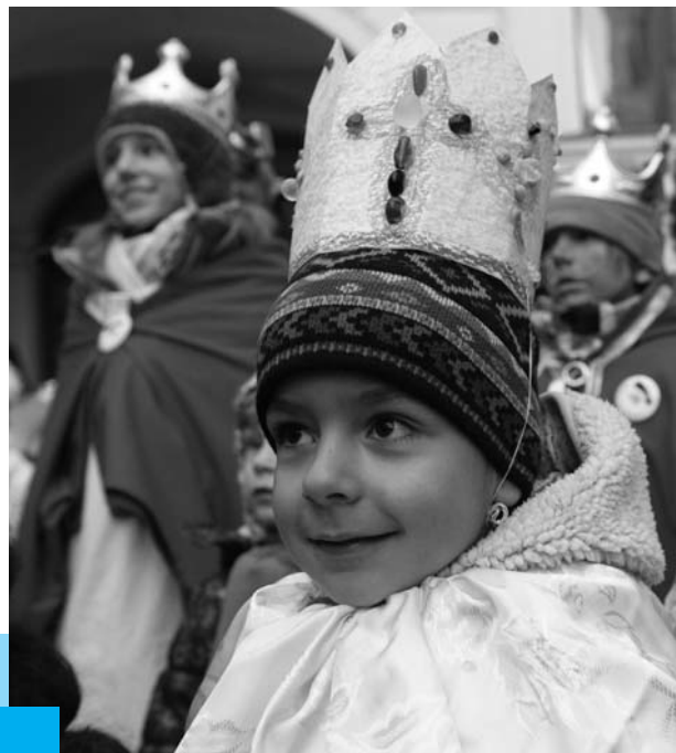
Tříkrálové koledníci na pražském arcibiskupství, leden 2011

Již tradičně Nadace ČS finančně přispěla na organizaci Tříkrálové sbírky pořádané Charitou ČR – v roce 2010 se tato největší charitativní dobrovolnická akce konala již podesáté v celostátním měřítku a vynesla přes 68 milionů Kč. Výnos sbírky je tradičně určen především na pomoc nemocným, handicapovaným, seniorům, matkám s dětmi v tísní a dalším jinak sociálně potřebným skupinám lidí. 65% se vrací zpět do regionů, kde byli peníze vykoledovány na podporu místních projektů. Desetina výnosu sbírky je určena na humanitární a rozvojovou pomoc v zahraničí.