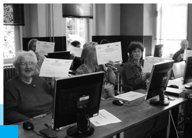
... a ve Vojkovicích

➡ „Podle statistických údajů žije v České republice zhruba 335 000 lidí ve věku nad 80 let. Ročně přes 400 lidí starších 60ti let spáchá sebevraždu. Za jejich hlavní příčinu se považuje ztráta smyslu života, sebeúcty a pocit, že se stávají přítěží pro společnost či rodinu. Mnohdy jsou aktivizační programy pro seniory jedinou motivací, která jim pomáhá udržovat společenský život a rozvíjet schopnosti, které vedou k udržení či zlepšení jejich psychické a fyzické kondice.“