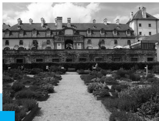
Bylinková zahrada ve Valticích, jeden z projektů na Greenway Praha - Vídeň

Do Greenways se v roce 2010 zapojilo 350 spolupracujících měst a obcí a značení bylo opraveno nebo doplněno na 615 km stezek.