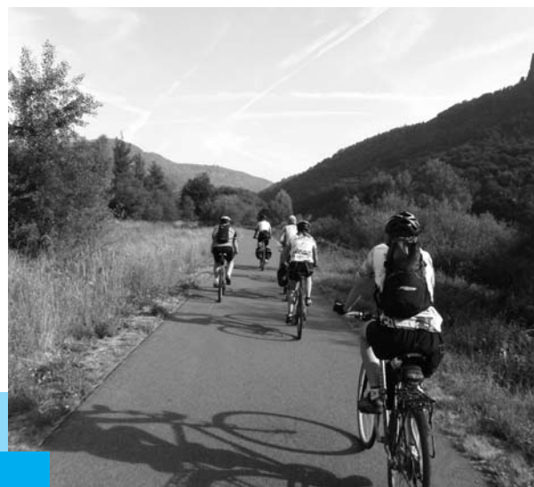
Na české části Labské stezky se každoročně budují nové úseky...

Část prostředků byla použita na rozvoj přeshraničních projektů se sousedními zeměmi, jejichž cílem je společný postup při zlepšování tras a vybavenosti středoevropských Greenways.