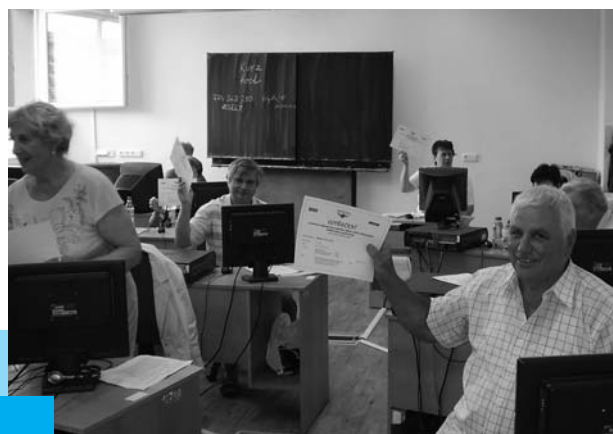
Účastníci kurzu Senioři komunikují v Nové Roli...

S tímto cílem jsme opět vstoupili do již 4. ročníku vzdělávacího programu Senioři komunikují, realizovaného společně s Nadačním fondem Livie a Václava Klausových . Tento seriál kurzů pořádají po celé České republice organizace, které zvítězí v grantového řízení. Jejich cílem je podpora vzdělávání seniorů v oblasti ovládnání a užívání osobních počítačů, platebních karet a mobilních telefonů. Podpora je směřována především na tu skupinu našich seniorů, která dosud neměla příležitost seznámit se s těmito moderními komunikačními prostředky. Každý kurz je určen pro 10 – 12 posluchačů a obsahuje 12 hodin věnovaných práci na počítači, 1 hodinu platebním kartám a 1 hodinu mobilním telefonům. Nadace České spořitelny je partnerem programu od jeho vzniku v roce 2007. Od té doby se podařilo zrealizovat za jejího finančního příspěví 523 kurzů v 389 městech. Do „školních lavic“ tak zasedlo více než 5 tisíc studentů-seniorů. Tato čísla dokládají velký zájem o kurzy mezi seniory - tím největším důkazem jejich úspěšnosti je fakt, že absolventi dnes již směle „surfuji po internetu“. Na samotné výuce se podílejí i zaměstnanci České spořitelny, a.s., kteří si na kurzech mají možnost vyzkoušet roli lektorů seznamujících seniory s výhodami platebních karet. V loňském roce si tak roli lektora vyzkoušelo 94 zaměstnanců.