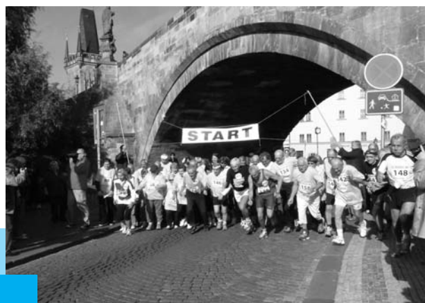
Seniorská míle