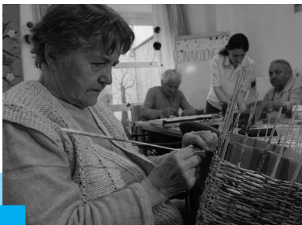
Seniory z Domova pokojného stáří sv. Alžběty Diecézní charity Plzeň

Jiné podobě pomoci seniorům se věnujeme ve spolupráci s Charitou ČR . Ta se o seniory stará ve více než 40 domovech pokojného stáří a domech s pečovatelskou službou. Snaží se jim zde vytvořit podmínky pro klidné a důstojné prožití podzimu života. Z daru Nadace ČS byly podpořeny činnosti jednotlivých diecézních a arcidiecézních charit, např. nízkoprahového zařízení pro děti a mládež Vata v Židlochovicích či nízkoprahového zařízení Zrnko ve Vsetíně; byly určeny také na nákup polohovacích lůžek a sprchovacích křesel pro Oblastní charitu Strakonice, dostavbu klubu ATRIUM pro seniory v Hradci Králové a nákup osobního automobilu pro projekt Magdala diecézní charity v Litoměřicích. Dále byly prostředky použity na stavební úpravy a opravy Domova pro seniory Hnojník diecézní charity ostravsko-opavské, položení základů novostavby sociálně terapeutických dílen sv. Josefa v Meclově a stavební úpravy Centra sociální rehabilitace sv. Vavřince na Domažlicku či na úpravy Domu pro seniory v Mukařově.