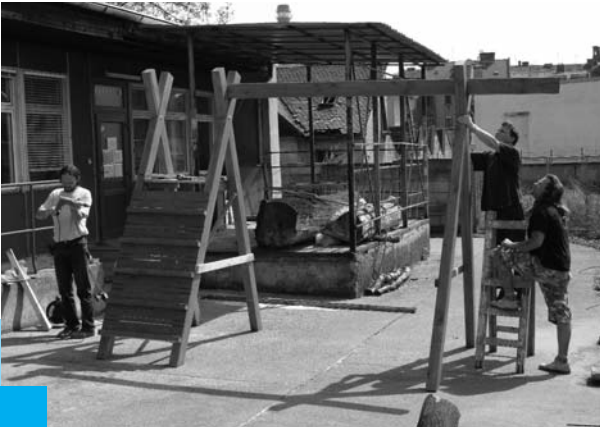
Terapeutická dílna EIKÓN

Třetím rokem se nadace podílela na projektu Manufaktura občanského sdružení Podané ruce . Sdružení prosazuje komplexní přístup k poskytování služeb v oblasti prevence, léčby a pomoci lidem s problémy plynoucími z užíváním návykových látek a se závislým chováním. Služby poskytuje v kontaktních centrech v sedmi městech Jihomoravského, Olomouckého a Zlínského kraje. Věnuje se také terénním programům, primární prevenci a zaměřuje se na práci s dětmi a mladými lidmi ve školách v rámci volnočasových aktivit. Dlouhodobých projektů těchto center se zúčastňuje přibližně stovka škol.