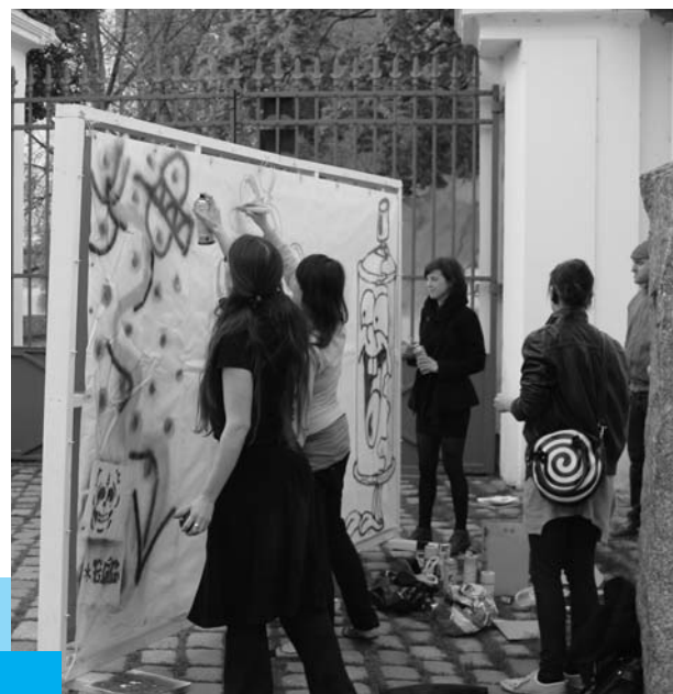
Výtvarná akademie - Street Art

Nově se v boji s drogami stala Nadace ČS partnerem obecně prospěšné společnosti Dialog Jesenius . Přispěla na drogově-preventivní vzdělávací projekt pro střední školy s názvem „Můžu ti pomoci?“. Cílem tohoto projektu je primární prevence rizikového chování a vytvoření funkčního mechanismu pro výchovu na školách, jehož nositeli jsou samotní studenti. Postatou je podpora smysluplného trávení volného času v kreativních dílnách, kde studenti mohou trávit čas uměleckými disciplínami. Zapojit se mohou do kreativních laboratoří (filmová, výtvarná, hudební, fotografická, interaktivní), kde sami zpracovávají kampaně proti různým závislostem, jako jsou drogy, kouření, alkohol, workoholismus, patologické hráčství, nakupování, sex nebo jídlo.