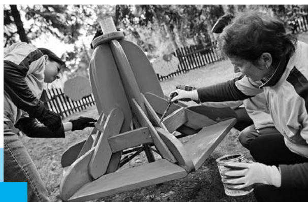
Dobrovolníci z České spořitelny pomáhají v rámci Dne pro charitu

Spolupráci s nadačními partnery prohlubujeme nejen prostřednictvím společných projektů, do aktivit našich partnerů se formou dobrovolné pomoci mohou zapojit i zaměstnanci České spořitelny, a.s. Od roku 2007 mají zaměstnanci České spořitelny (zřizovatel Nadace ČS), možnost využít dva pracovní dny ročně na práci pro neziskový sektor. Za 4 roky se Dnů pro charitu účastnilo 4 434 dobrovolníků, kteří pomáhali – ať už manuální prací nebo svými odbornými znalostmi - ve 119 organizacích. A pomáhali také partnerům Nadace České spořitelny – v r. 2010 např. Českému svazu ochránců přírody, zejména regionálnímu sdružení Iris Prostějov nebo v domě Portus, Centru denních služeb pro seniory, které provozuje občanské sdružení Život 90.