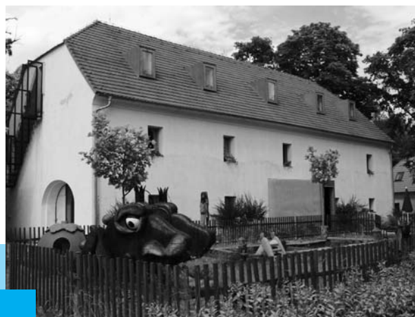
Terapeutická komunita, Karlov

Významnou část finančního příspěvku na rok 2010 věnovalo sdružení na pokračující revitalizaci areálu Terapeutické komunity Karlov, především na dokončení objektu Hájenka, na opravu vnitřních komunikací, revitalizaci zeleně a vybudování sportovního a dětského hřiště. Druhou důležitou část využilo na rozšíření projektu a doplnění vybavení sociální firmy Café Therapy a Poradny pro rodiče spojeného s provozem „anonymní kavárny a obchodu“. Prostředky byly využity dále na aktivity zaměřené na matky v léčbě, na harmonický rozvoj dětí a obnovu jejich vztahu s matkou a opětovně také na podporu nových technologií (zejména internetu) v prevenci a poradenství.