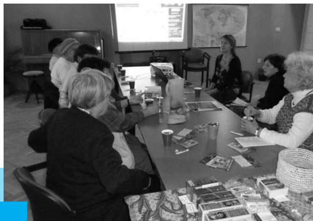
Cestovatelský klub