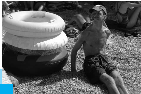
Slunce pro všechny, projekt OP Kladno

Mezi naše další dlouhodobé partnery v regionech dále patří i občanská sdružení Volno v Kolíně a LOGO v Brně, Centrum LADA