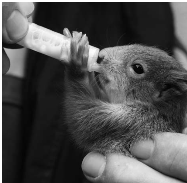
Čtyři záběry na péči o zvířata v záchranných stanicích