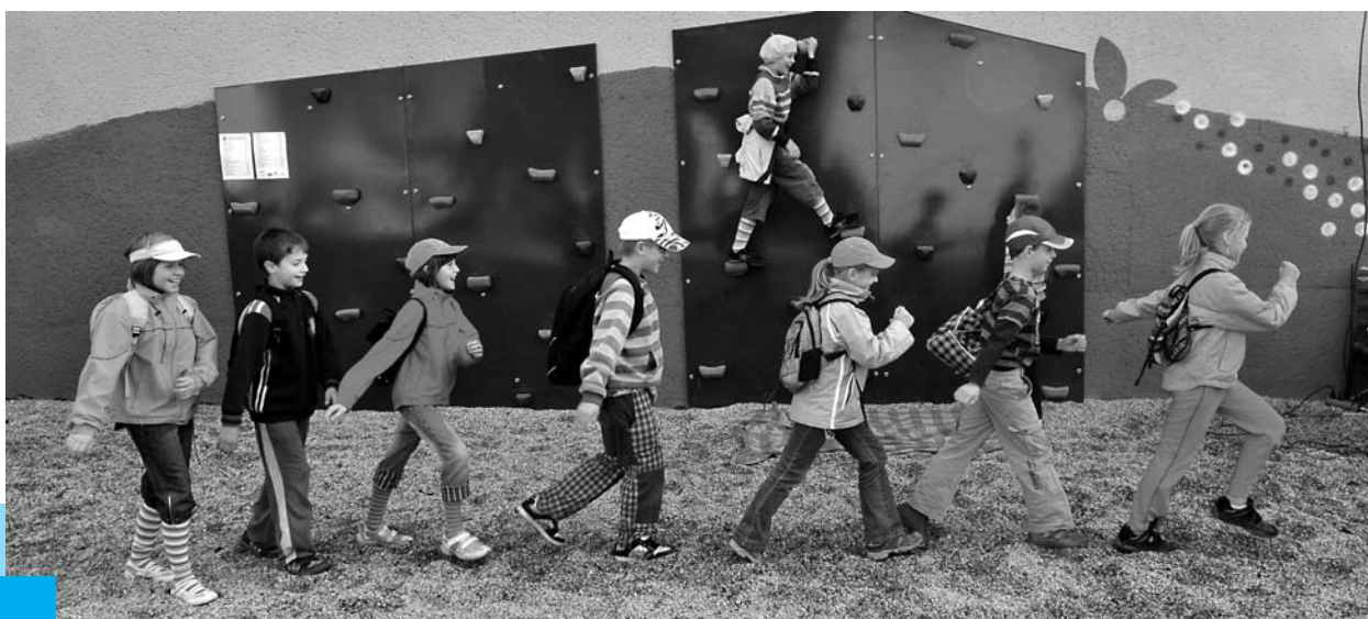
Nově vybudovaná lezecká stěna, Kyjovická "Zahrada setkání", (Moravskoslezský kraj).